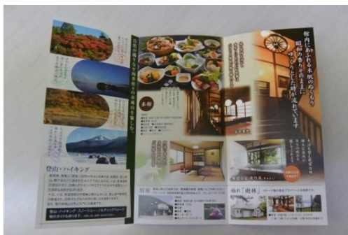
【PRの強化を目的としたチラシやパンフレットの作成】