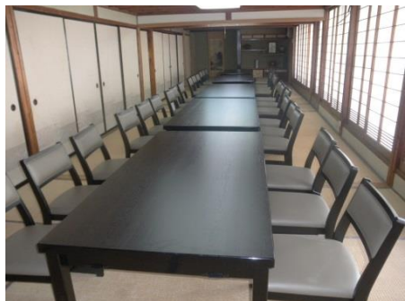
【新規顧客獲得のための新設備・什器導入】