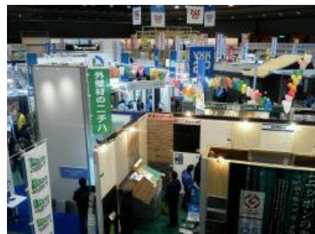
【販路開拓のための展示会出展】