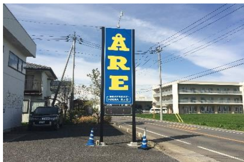
【店舗の認知度向上を狙った看板（サイン）の設置】