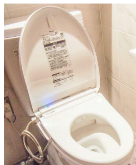
【トイレの洋式化改修】